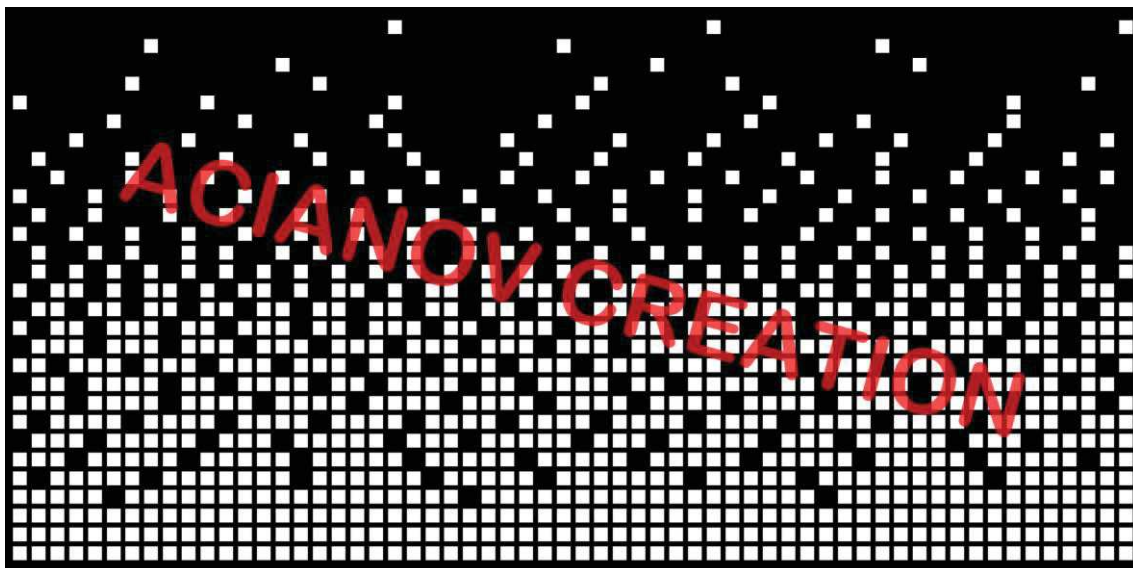
Format présenté : 1000 x 2000 mm

Image à votre format et en couleur (toutes les nuances RAL disponibles) sur simple demande à l'adresse : acianov@orange.fr