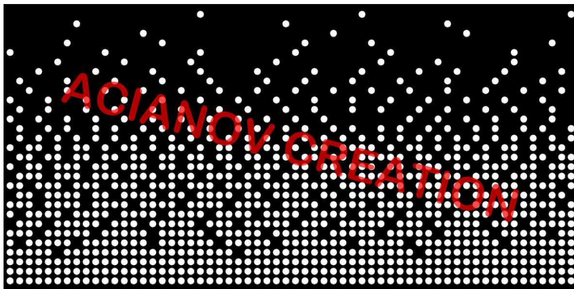
Format présenté : 1000 x 2000 mm

Image à votre format et en couleur (toutes les nuances RAL disponibles) sur simple demande à l'adresse : acianov@orange.fr