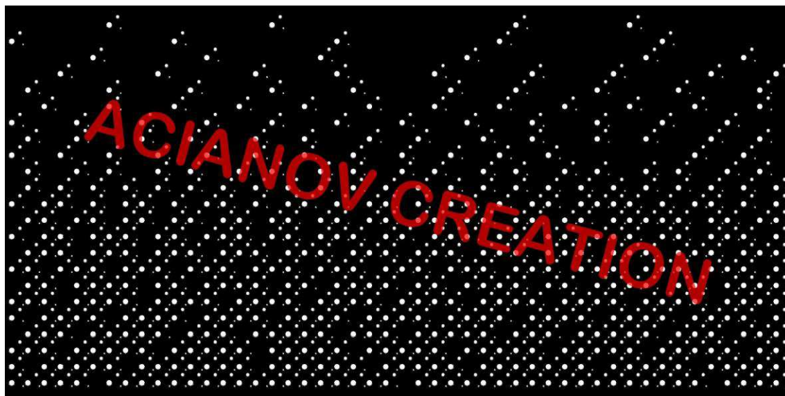
Format présenté : 1000 x 2000 mm

Image à votre format et en couleur (toutes les nuances RAL disponibles) sur simple demande à l'adresse : acianov@orange.fr