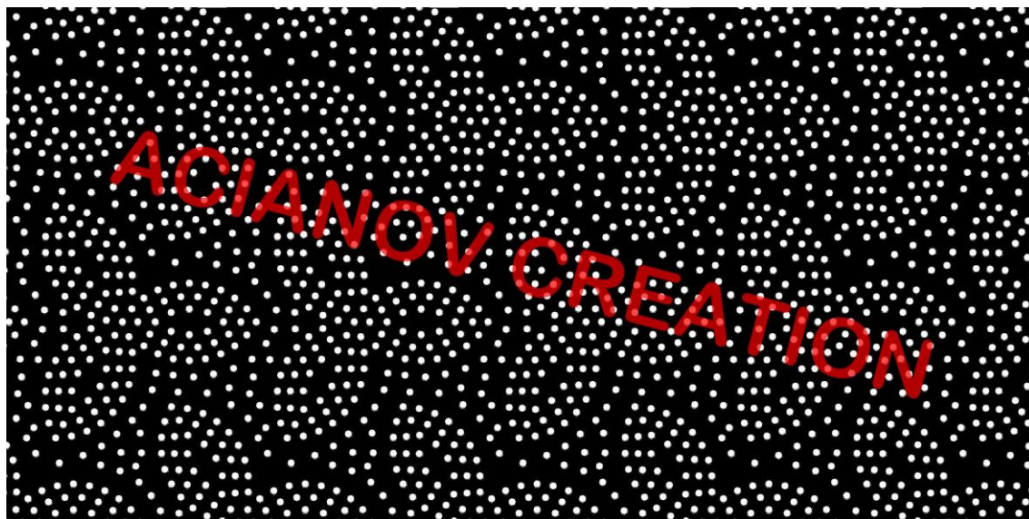
Format présenté : 1000 x 2000 mm

Image à votre format et en couleur (toutes les nuances RAL disponibles) sur simple demande à l'adresse : acianov@orange.fr